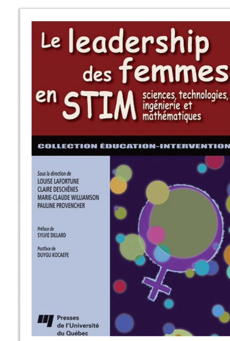
Le leadership des femmes en STIM